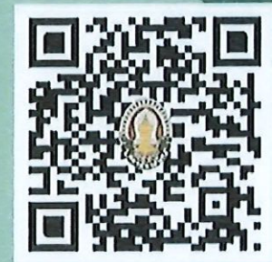
สแกน QR Code เพื่อดูรายละเอียดเพิ่มเติม